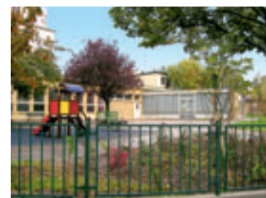
Le site de l'école Saint-Hubert, Thionville Côte des Roses

L'équipement ouvrira ses portes à la rentrée 2011, tandis qu'au printemps prochain, c'est le chantier du 3 e investissement porté par la Communauté d'Agglomération qui démarrera à son tour, à Thionville, Côte des Roses . Il s'agira là aussi de la réhabilitation d'un bâtiment existant, l'école Saint-Hubert , aujourd'hui désaffectée.