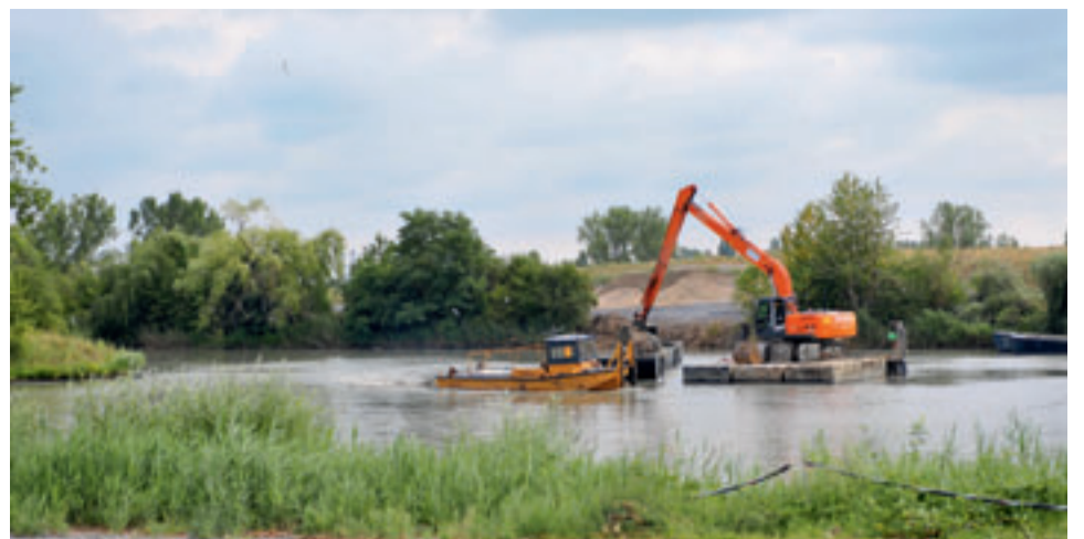
Basse-Ham, creusement de l'étang, juillet 2010

Ce nouveau programme porte donc sur la création de 20 km de liaisons cyclables nouvelles , représentant un investissement global estimé à 2,35 Millions € , pour le financement duquel, des subventions sont sollicitées auprès de l'Union Européenne au titre du FEDER, du Conseil Régional de Lorraine et du Conseil Général de la Moselle. Au titre des liaisons intercommunautaires prévues en 2010, le tronçon Thionville - Uckange a été mis en service au mois de septembre, tandis que s'achève aujourd'hui celui entre Illange et Bertrange .