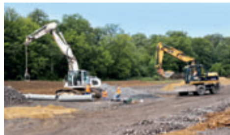
Le chantier, août 2010

étant prévu à partir de 2011 dès lors que la phase de procédures préalables sera achevée. Ainsi, Portes de France - Thionville aura répondu à l'obligation à laquelle elle était tenue.