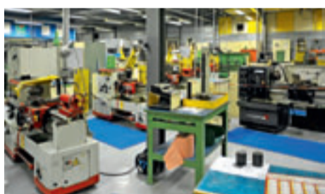
Un atelier du CFAI

Deux inaugurations ont marqué la rentrée à Cormontaigne. Il y eut tout d'abord l'inauguration de l'espace des sports du Centre de Formation d'Apprentis de l'Industrie le 10 septembre, suivie de celle du Centre de Formation aux métiers de l'acier, le 5 octobre, confirmant la dynamique de ce site dédié au tertiaire supérieur.