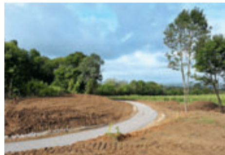
Le chantier, septembre 2010

Ce nouveau programme porte donc sur la création de 20 km de liaisons cyclables nouvelles , représentant un investissement global estimé à 2,35 Millions € , pour le financement duquel, des subventions sont sollicitées auprès de l'Union Européenne au titre du FEDER, du Conseil Régional de Lorraine et du Conseil Général de la Moselle. Au titre des liaisons intercommunautaires prévues en 2010, le tronçon Thionville - Uckange a été mis en service au mois de septembre, tandis que s'achève aujourd'hui celui entre Illange et Bertrange .