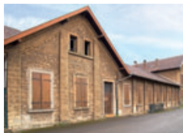
Le site de l'école du Haut-Pont, Fontoy

Le bâtiment (770 m 2 ) comportera également une antenne du Relais Assistants Maternels, déjà présent à Fontoy une fois par mois, dans les locaux de la Bibliothèque-Ludothèque où sont accueillies les familles et où sont organisées les animations proposées aux enfants accompagnés de leur Assistant maternel. Le coût de réhabilitation du bâtiment est établi à 1 240 000 € ; l'investissement devrait également bénéficier de participations financières à hauteur de 80 %. De même, et parce que le projet intègre aussi la prise en compte de normes environnementales,