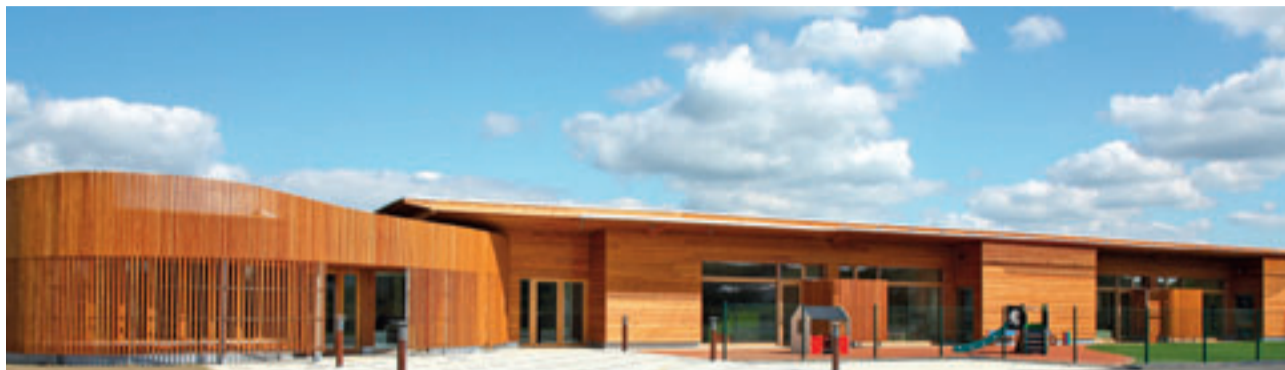
Les Petits de l'Olympe

Ouverture du premier équipement multiaccueil communautaire à Yutz, lancement des travaux du site de Fontoy... La Communauté d'Agglomération affiche plus que jamais son soutien aux familles.