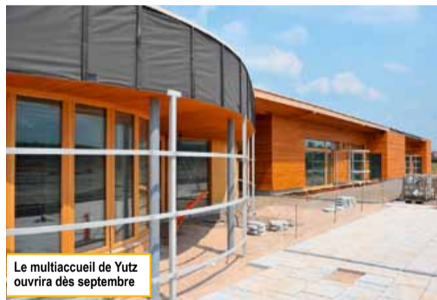
Le multiaccueil de Yutz ouvrira dès septembre

Investissement de 1 800 000 €, le multiaccueil de Yutz a obtenu des concours financiers à hauteur de 80% au total, de l'Union Européenne au titre du FEDER, de l'État, du Conseil Général de la Moselle, de la Caisse d'Allocations Familiales 57 (CAF). Sans oublier de citer enfin l'ADEME qui, au titre du PREBAT, a participé au financement des investissements éco-responsables. Pour compléter l'information financière sur ce projet, l'on ajoutera que la CAF 57 supportera également 50 % du coût du premier équipement nécessaire au démarrage de la structure (mobilier enfants, jeux, mobilier de bureau, informatique, linge, vaisselle...).