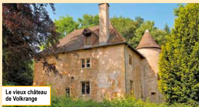
Le vieux château de Volkrange

Cette exposition itinérante fera une première étape à Illange à partir du 1 er octobre 2010 et sillonnera ensuite toutes les communes de la vallée. Toutes les informations relatives au déroulement de cette exposition seront disponibles, le moment venu, sur le site Internet de l'Agglo.