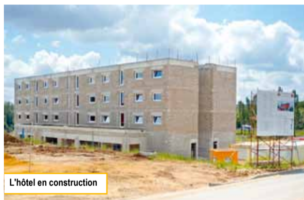
L'hôtel en construction

L'attractivité du complexe de cinémas et le positionnement optimal du site directement raccordé au réseau autoroutier a joué un rôle moteur dans le choix d'implantation de nombreuses enseignes des secteurs de la restauration, de l'hôtellerie et des loisirs.