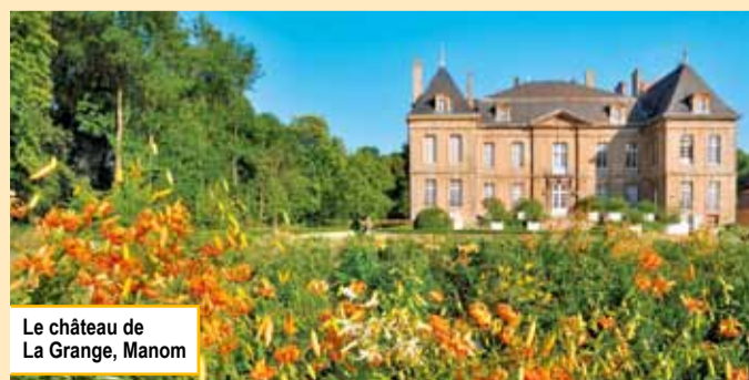
Le château de La Grange, Manom

Journal de la Communauté d'Agglomération Portes de France - Thionville N°15 - Juin 2010 - N° ISSN : 1779-0395 - Dépôt Légal : 2005 12.0097 Directeur de la publication : Patrick Weiten, Président de la Communauté d'Agglomération Rédaction : Service Communication Conception et réalisation : Horizon Bleu Impression : Est-Imprimerie - Tirage : 40000 ex. Site internet : www.agglo-thionville.fr Pour joindre la Communauté d'Agglomération : 03 82 526 526.