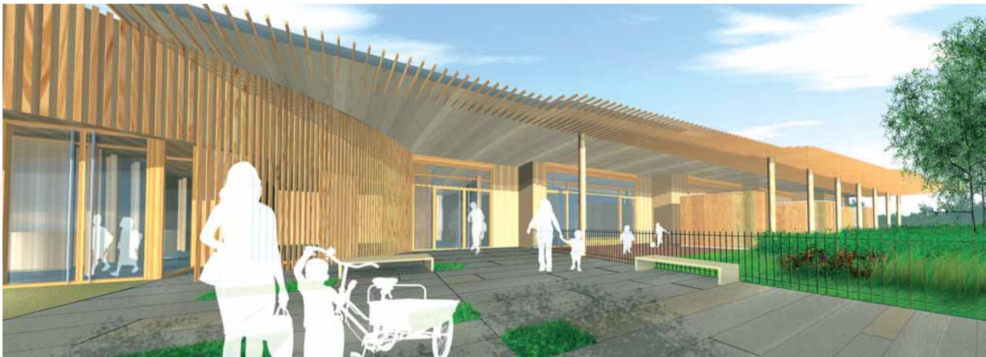
Esquisse du multi-accueil de Yutz © Agence MIL LIEUX / CAPFT

A présent, le projet va pouvoir entrer dans sa phase pré-opérationnelle. Une fois que les architectes auront réalisé les étapes successives d'élaboration du projet architectural (APS puis APD), les Services de l'Agglomération, assistés de l'équipe de conception, constitueront le Dossier de Consultation des Entreprises (DCE) en vue de l'appel d'offres travaux. Ainsi, le lancement du chantier pourra être envisagé à échéance de mi-2009, pour une ouverture programmée à la rentrée 2010.