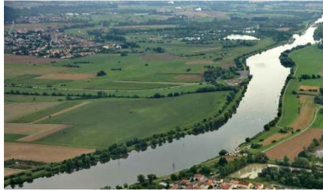
Parking : Stade de football de Thionville - Garche

Eglise Saint-Rémi de Hussange - Koeking : la base du clocher serait d'époque romane (XI e -XII e siècle). Les fonds baptismaux, taillés d'un seul bloc, datent du XV e siècle et figurent dans l'inventaire général des richesses artistiques de la France. L'église de Husange possède aussi une grotte de Lourdes, qui a été érigée suite à un vœu de Nicolas Kemel, paroissien de Husange-Koeking. Réalisée en 1923, la grotte fut inaugurée le 14 octobre 1923.