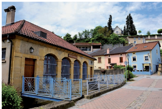
Parking : ancien lavoir de Fontoy

Le circuit du Woess vous transportera le temps d'une promenade des mérovingiens aux mines de fer.